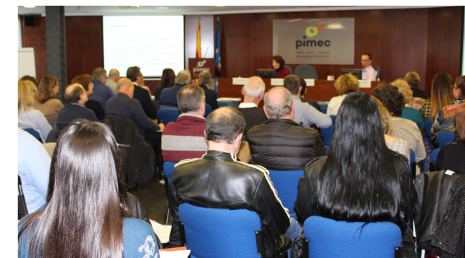
Imagen de la última jornada del Departament de Salut, Generalitat de Catalunya, en FETOR